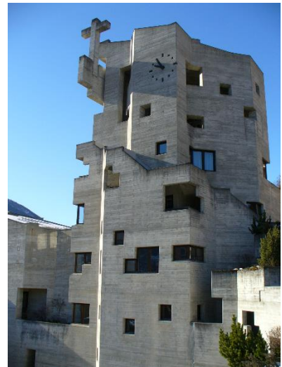
St. Nicolas in Hérémece im Wallis (CH)

Der Schweizer Architekt Walter Maria Förderer (1928-2006) ist ein Hauptvertreter des neo-expressionistischen Kirchenbaus der 1960er Jahre. Seine aus Beton gegossenen, von kubischen Elementen beherrschten Bauten, wie St-Nicolas in Hérémece (Wallis, CH), sind markant, dominant und provokativ. Ebenso provozierend ist seine publizistische Tätigkeit. Was Förderer zum Kirchenbau schrieb, war für die Diskussion um Gemeindezentren und multifunktionale Räume Ende der 1960er Jahre zentral. Im Bezug auf seine eigenen Bauten prägte Förderer früh den Begriff der „Gebilde von hoher Zwecklosigkeit“. Ob ein Kirchenbau mit seiner auch von der Liturgie bestimmten Bauform dies jedoch überhaupt sein kann, darum rang Förderer lange Zeit selbst.